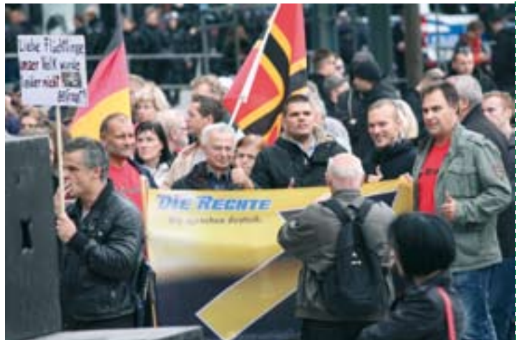
Nazis bei Protest

In der Oberschule vor Ort haben auch viele Schüler_innen Vorurteile gegen Asylsuchende und Muslime. Mittlerweile fanden Workshops zu Flucht und Asyl statt. Diese Workshops führten allerdings noch nicht zu einer wahrnehmbaren Veränderung des Klimas an der Schule.